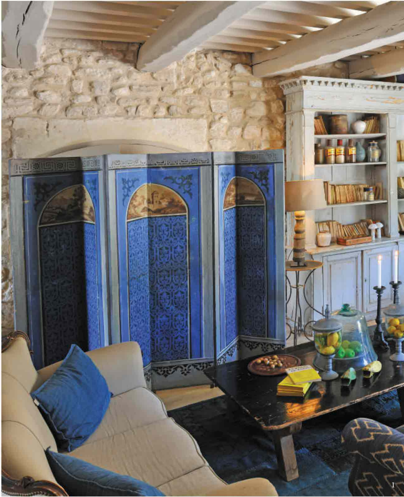
1. La Bastide de Marie 2. La Bastide de Marie 3. Lopud 1483, Dubrovnik 4. Lopud 1483, Dubrovnik